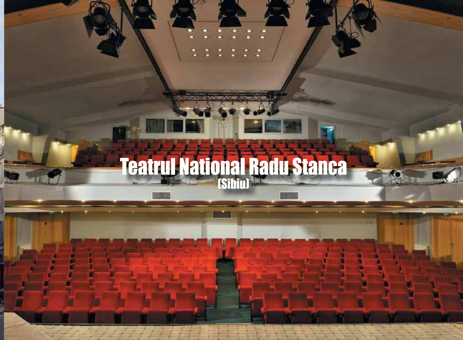
Teatrul National Radu Stanca (Sibiu)