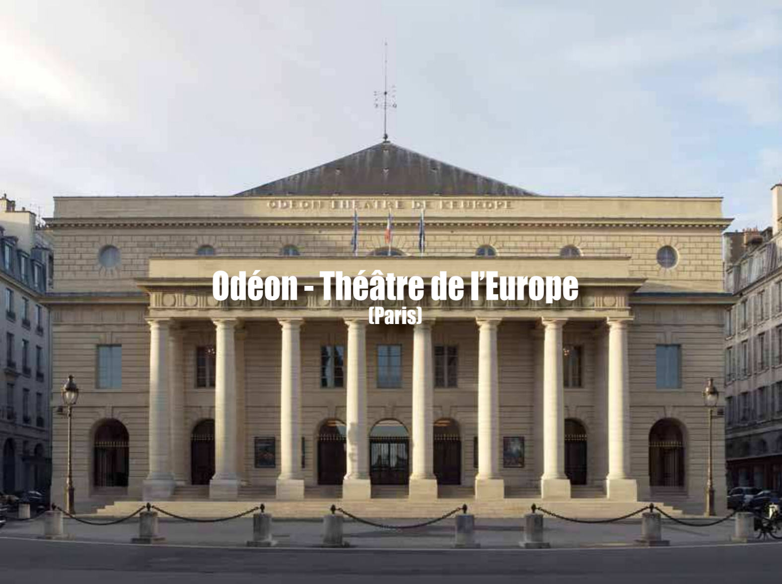
Odéon - Théâtre de l'Europe (Paris)