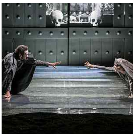
Una scena dell'Orestea

Ci sono spettacoli, che converrebbe vedere più volte. Accade di rado ma accade. Ed aumenta così il piacere dello spettatore. Credo sia il caso dell'"Orestea" che Luca De Fusco ha messo in scena sul palcoscenico del "suo" Teatro Mercadante.